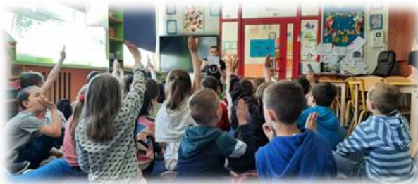
Bezpiecznie nad wodą