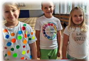
Moda na Dzień Kropki