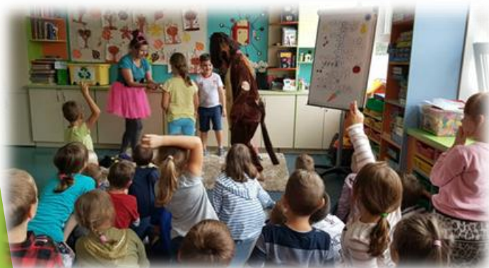
Mój przyjaciel zwierzak