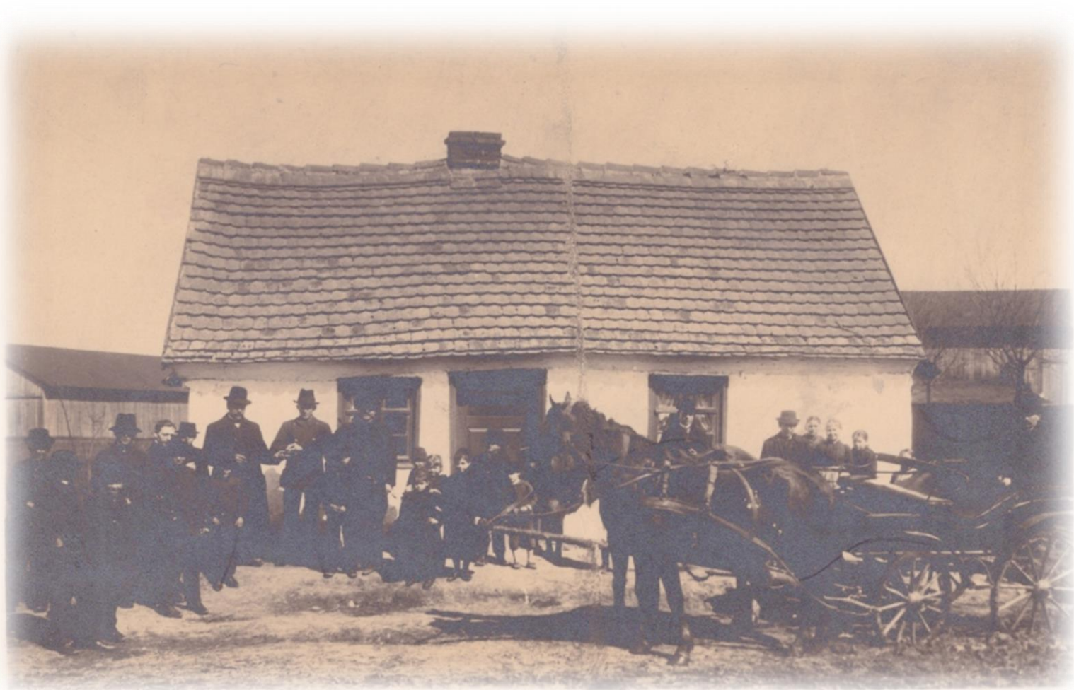
Dom Kasprowiczów – przełom XIX i XX wieku.