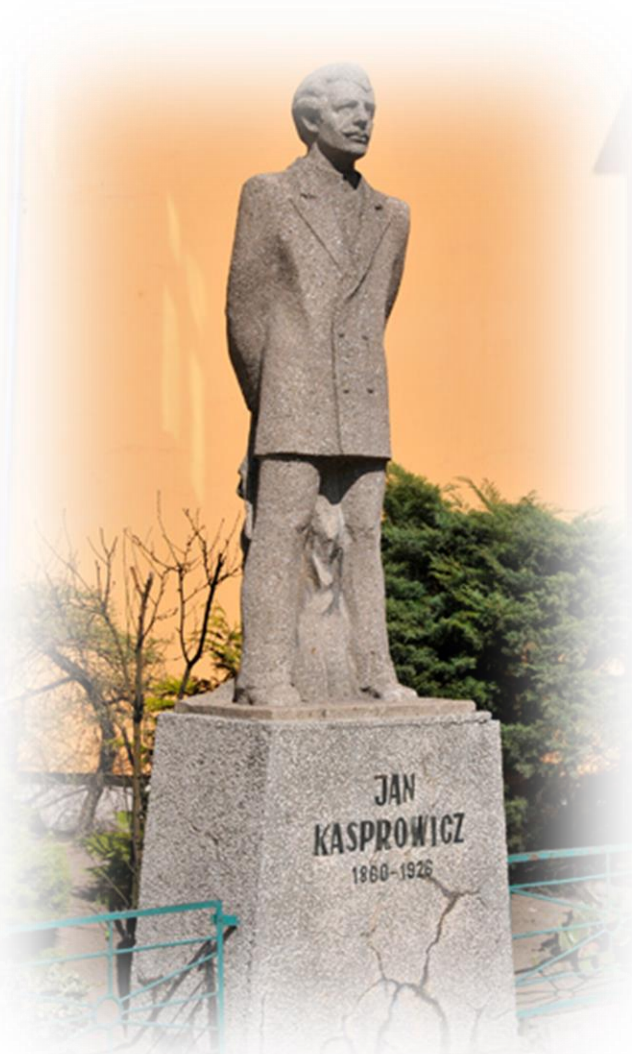
Pomnik Jana Kasprowicza

Edukację zaczął w szkole w Szymborzu dzięki wiejskiemu nauczycielowi, który dostrzegł w nim wielki talent. Jako dziesięciolatek zaczął naukę w gimnazjum, później zdał maturę i rozpoczął studia na uniwersytetach Wrocławia i Lipska.