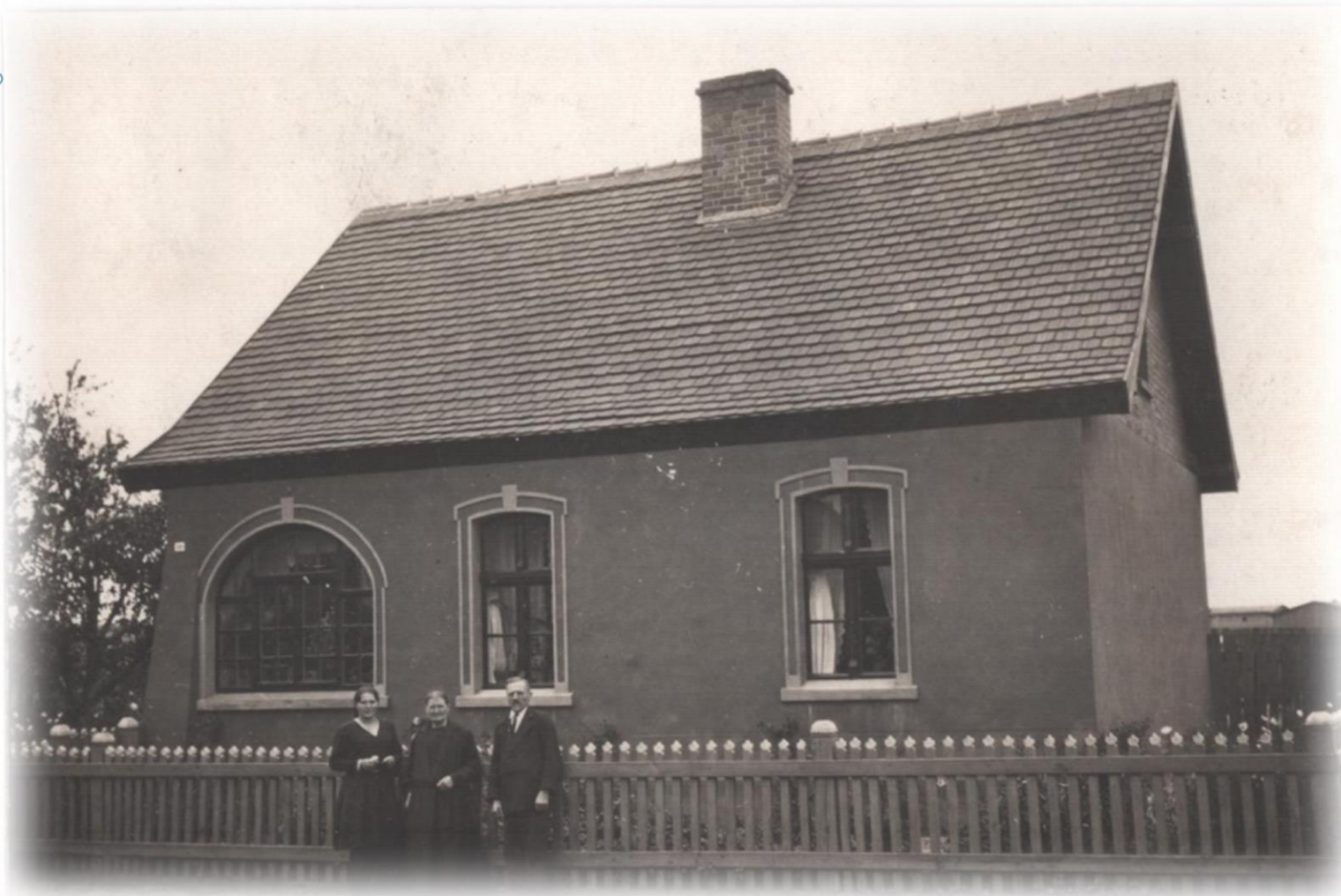
Dom Kasproiczów – okres międzywojenny.