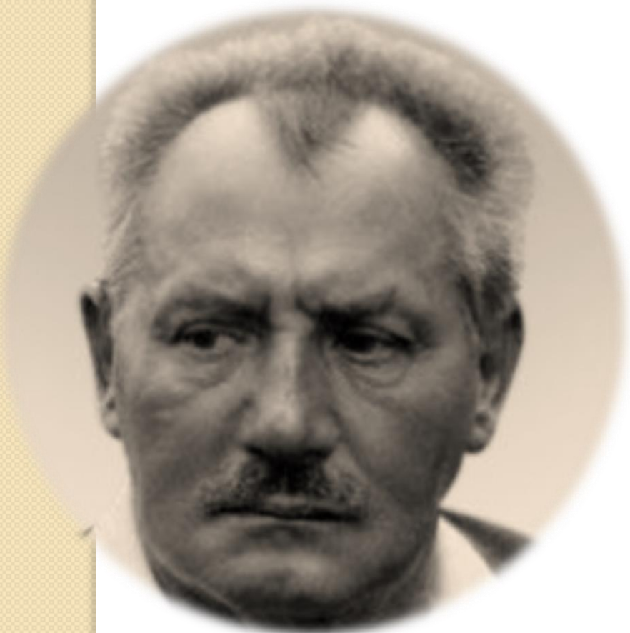
Jan Kasprowicz 1860 - 1926