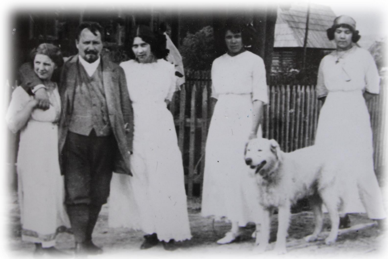
Zdjęcie rodzinne – poeta z żoną i córkami.